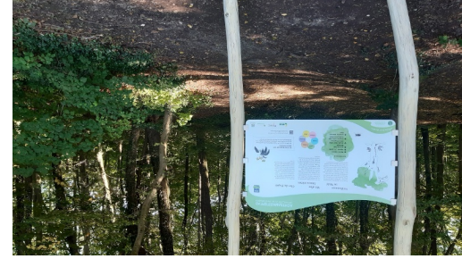
Eingangstafel Achtamskeitspfad