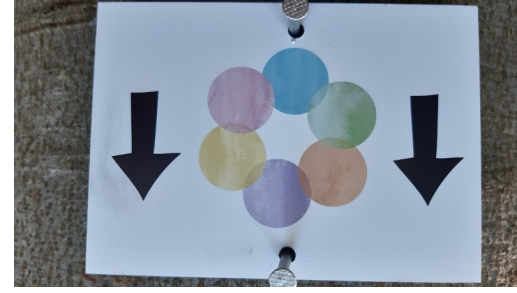
Wegmarkierung Achtamskeitspfad