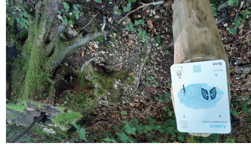
Station "Atmen"