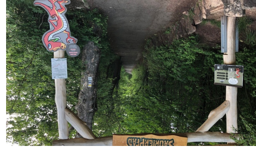
Tor zum Saurierpfad "Trixi Trias"