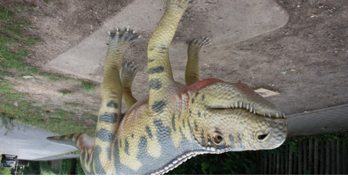
TOP Saurierpfad "Trixi Trias"