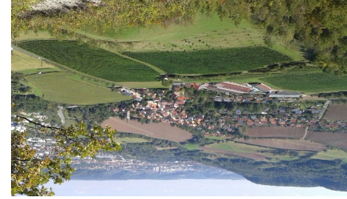
Blick vom Großen Gleisberg nach Kunitz mit Wehberg Grafenberg im Vordergrund