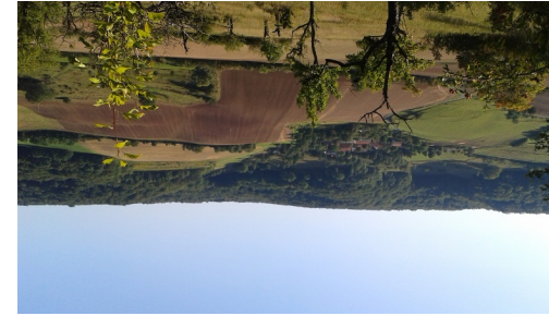
Blick vom Großen Gleisberg Richtung Richtung Laasan